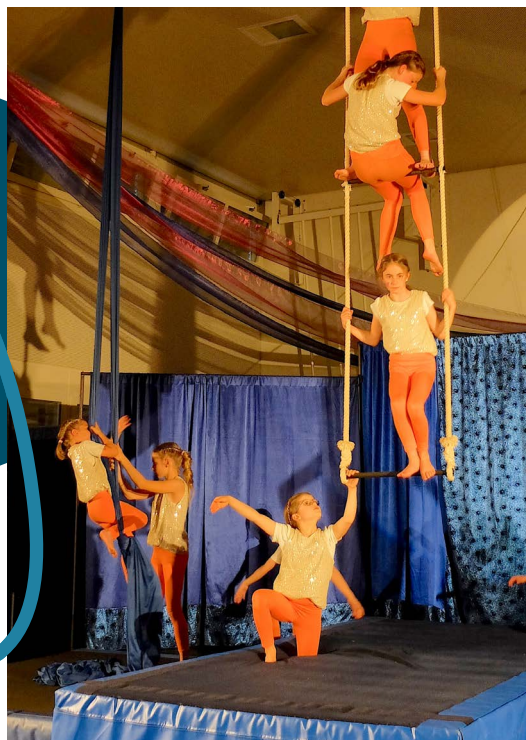
In zwei Aufführungen zeigten die Rickenbächler Kids ihre artistischen Fähigkeiten.