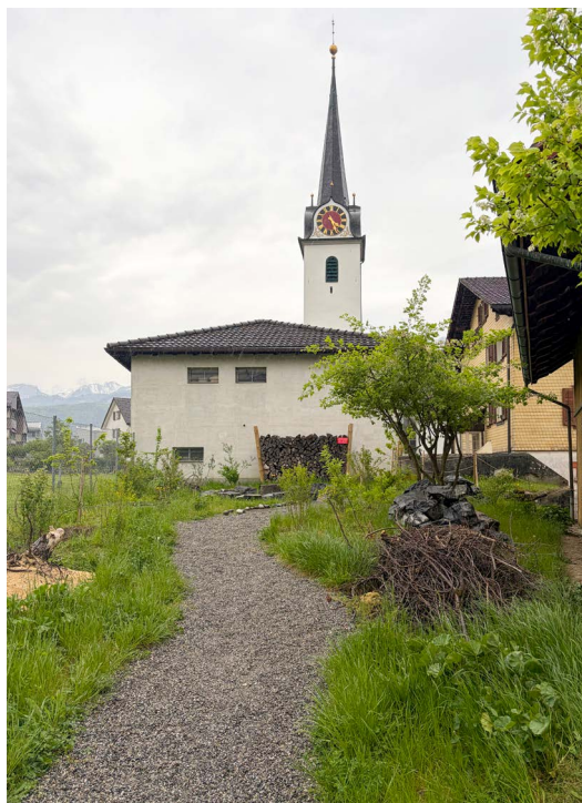
Die Fläche beim Schulhaus Seerüti vor und nach der Umgestaltung.