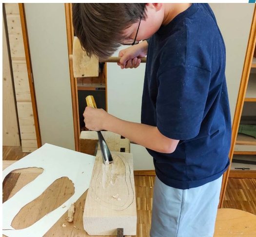
In der Werkstatt der MPS Schwyz wird intensiv an den Holzschuhen gearbeitet.